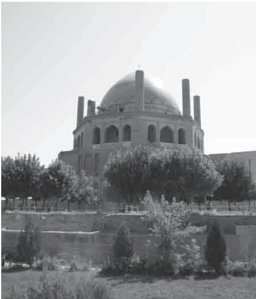
سلطانیه از جمله مناطقی از ایران است که ارامنه قبل از کوچ اجباری از ارمنستان توسط شاه عباس صفوی، در آن می‌زیستند

به ایران رانده‌اند [تاریخ مختصر جامعه ارمنی در ایران، ادیک باغداساریان (به زبان ارمنی)، تهران، ۱۳۸۰، ناشر: مؤلف].